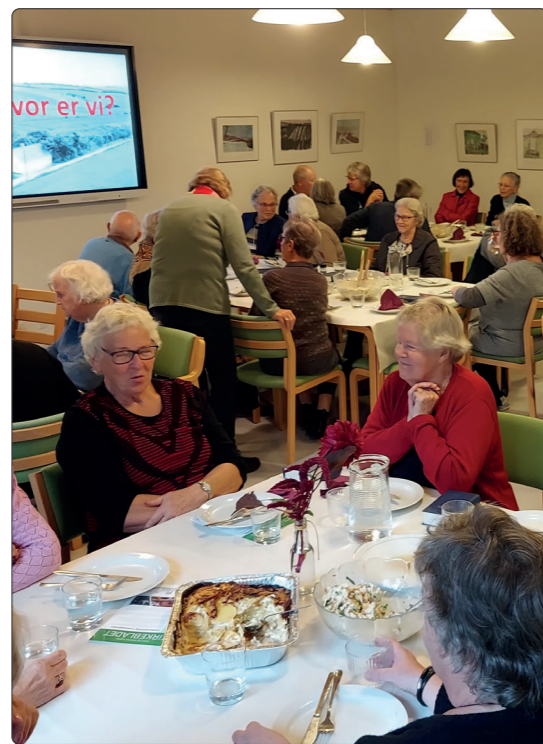
Fællesspisning i præstegården 29/9