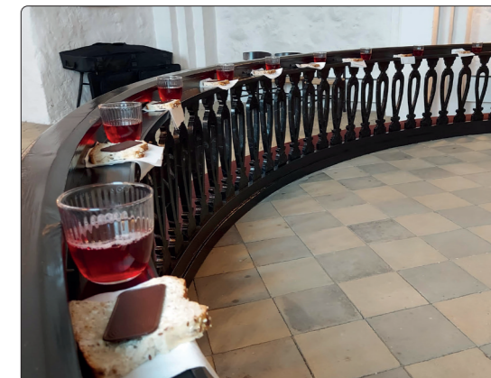
Konfirmandundervisning om nadver.