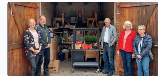
Hele konfirmandlokalet var i perioden marts-slut maj pakket ned ...