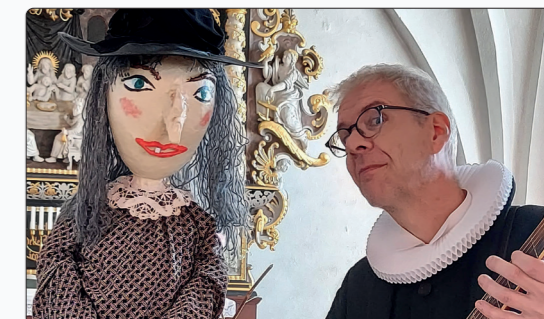
Fra minutterne før årets Sankt Hans-gudstjeneste for børnehuset Giraffen.