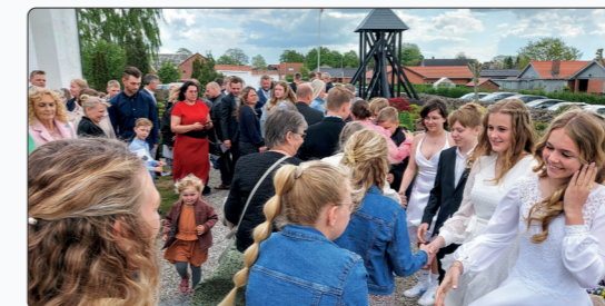
Årets konfirmander Bededag 2022. Lidt blæsende, men en dejlig dag.