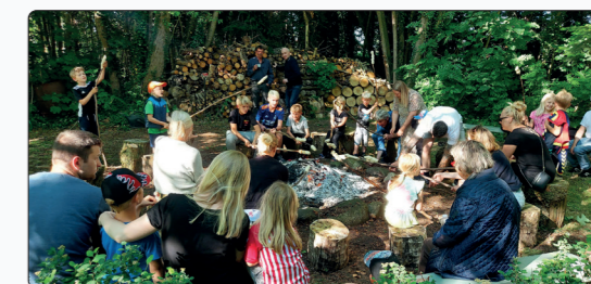
Godt vejr var med til at gøre Sankt Hans-arrangementet i præstegårdshaven i Glud til en succes.