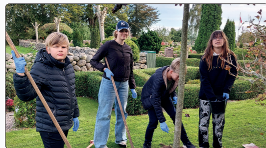
Sidste års konfirmander på arbejde på kirkegården.