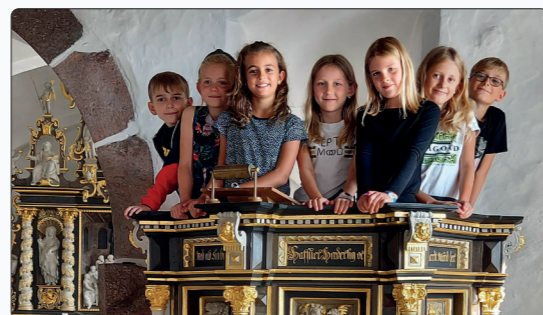
Minikonfirmander årg. 2020 på prædikestolen i Glud Kirke.

Det er som altid 3. klassetrin på Glud Skole, der tilbydes et minikonfirmandforløb. I år er der info-møde tirsdag den 6. september kl. 17.00 i konfirmandlokalerne. Deltagelse i mødet er obligatorisk, hvis man ønsker at være minikonfirmand. Selve minikonfirmand-eftermiddagene starter tirsdag den 13. september og fortsætter de følgende 10 tirsdage. Som altid deltager årets minikonfirmander både i høstgudstjenesten i Glud Kirke og gudstjenesten 1. søndag i advent.