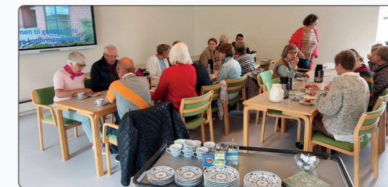
hvorfor det også var en glædelig 2. Pinsedag at kunne byde indenfor igen.