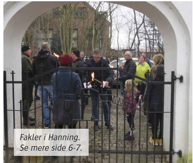
Fakler i Hanning. Se mere side 6-7.