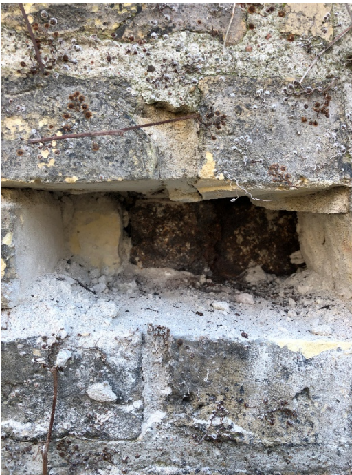
Stålet bør udskiftes, under arbejdet.