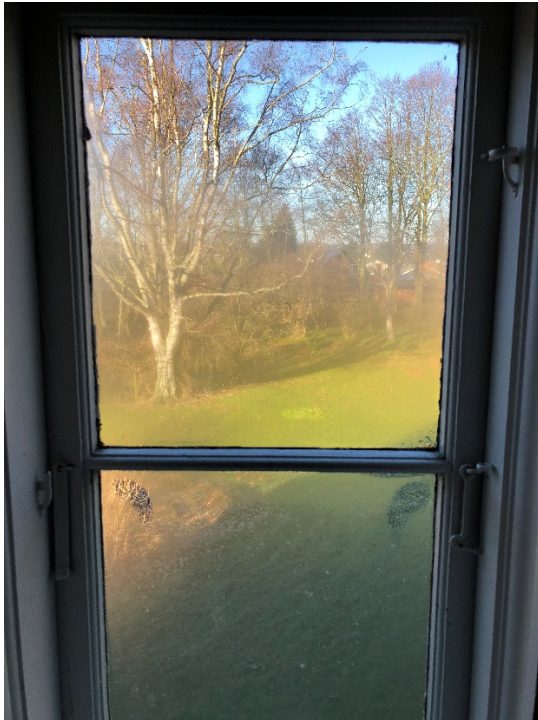
Kondens dannelse på indvendigt vindue på 1.sal. Billedet er taget mod haven.