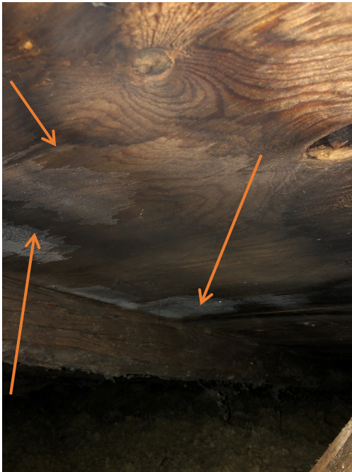
Fugt og skimmel er generelt problem på de synlige krydsfiners plader.