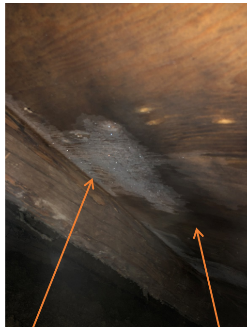
Frontispicen er opbygget med krydsfiners plade, og viser tydelige tegn på opfugtning, skimmel og frostskaeder i træværket, dette bør udbedres.