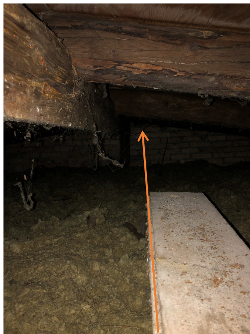
Under besigtigelsen indvendig tagkonstruktion af frontispicen, kunne der ikke konstateres synlig affugtning af synligt teglvæg.