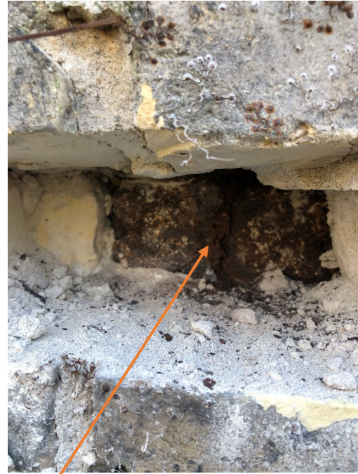
Indvendigt konstatering er stålbjælke over vinduer, som korrigeres grundet alder og fugt, og som trykker murværket ud.