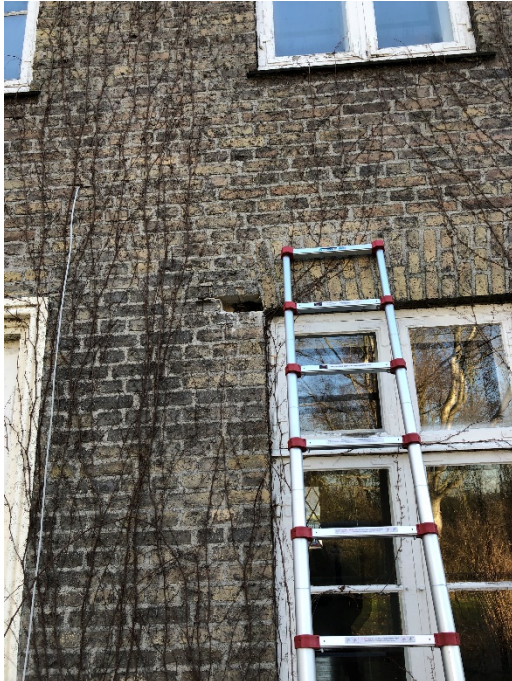
Frontispicen er åbnet op for besigtigelse, for at finde grundet til udskridningen på murværket.