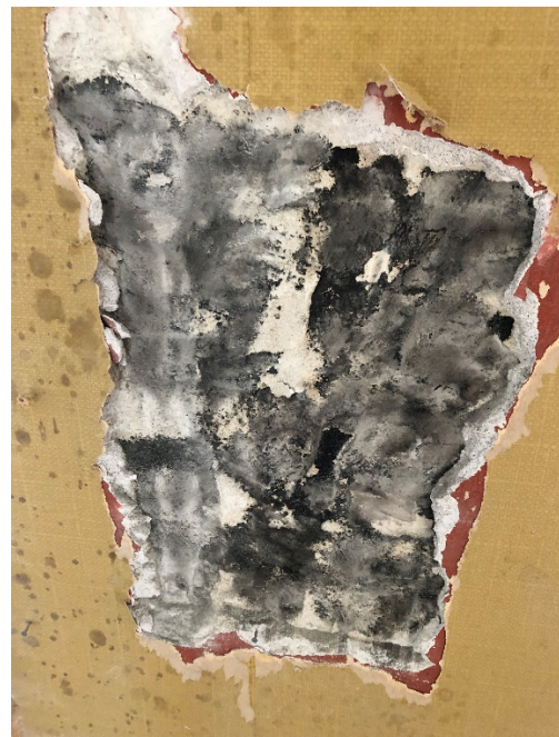
Facadevæg under pudslaget, er berappet med asfalt / tjærer produkt.