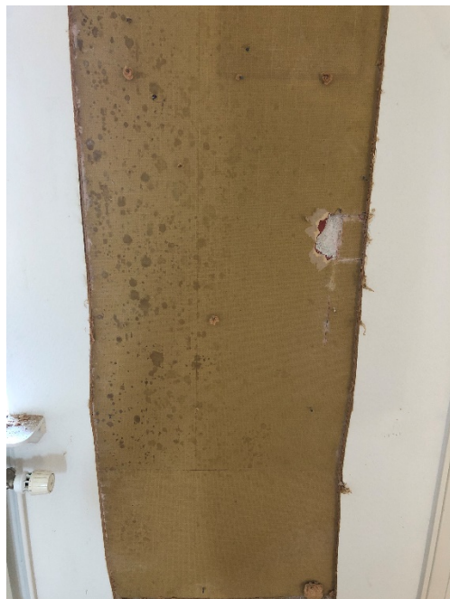
Indvendig besigtigelse vidste ikke tegn på indvendig fugtproblem, efter celotex pladen blev fjernet.