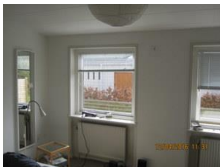
Foto 3. Besigtigede soveværelse

Ved besigtigelsen kunne der, som ved tidligere besigtigelse, ses mørke misfarvninger på ydervæg ved overgang imellem vægflade og loft. På loftfladen kunne der partielt ses mindre misfarvninger.