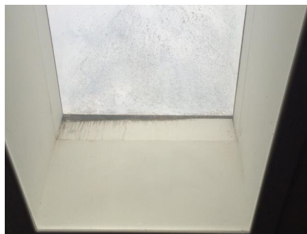
Foto 5. Lysskakt i arbejdsværelse

Der kunne kun konstateres ganske svage misfarvninger ved ovenlyskuppel i mellemgang mod arbejdsværelse.