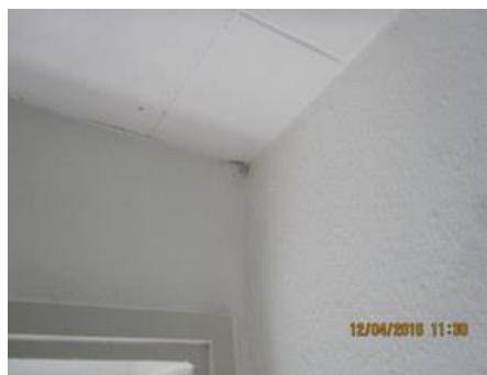
Foto 4. Misfarvninger på ydervæg mod loft

I ydervæggen kunne måles et fugtniveau på 48-53 digitale enheder, dvs normalt tørt. På besigtigelsestidspunktet pågik udluftning.