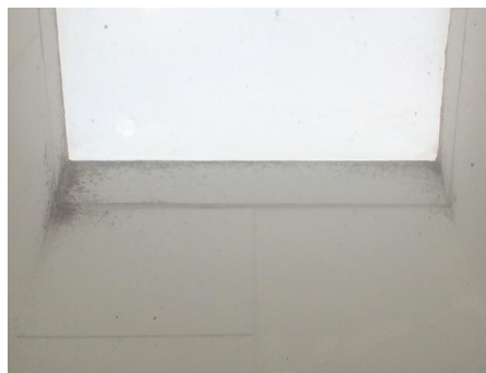
Foto 6. Lysskakt i entré

I arbejdsværelset udgøres siderne i lysning/lysskakt af bemalet plademateriale og i entré af bemalede pinup-plader, antageligt af gips.